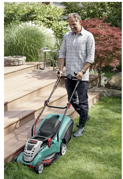
Bosch Rotak – ausgezeichnet mit dem AGR-Gütesiegel.

Möglichst mit rückergeordneten Gartengeräten arbeiten. Das heißt, ausreichend lange Stiele oder Teleskopstiele einsetzen, die sich individuell auf die jeweilige Körpergröße einstellen lassen. Diese erleichtern die aufrechte Haltung