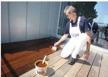
○7 Bangkirai-Öl auftragen