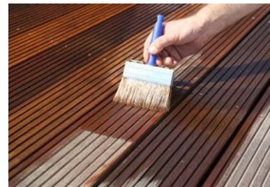
○9 Bangkirai-Öl auftragen closeup 2