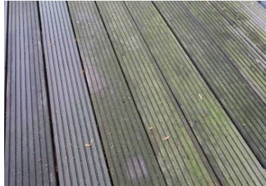
○2 Terrasse vorher Detail