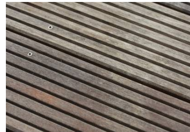
○6 Boden trocken und sauber