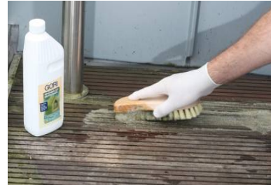
○3 Grünbelagferner auftragen