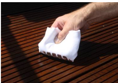
○10 überschüssiges Öl entfernen