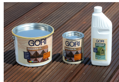
○12 Gori Bangkirai-Öl & Gori Grünbelag-Entferner

Die komplette Bildserie stellen wir Ihnen gerne und schnell auf elektronischem Wege in Farbe zur Verfügung. Bitte einfach die gewünschten Bilder und die Versandart ankreuzen und die Seite auf's Fax legen. Vielen Dank!