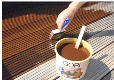
○8 Bangkirai-Öl auftragen closeup