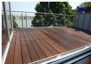
○11 Terrasse nachher