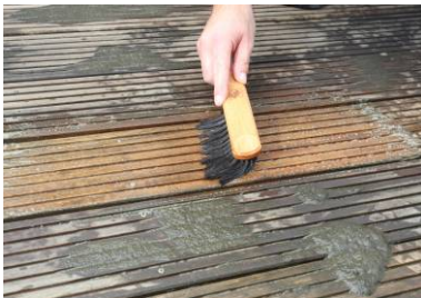
○4 Grünbelag entfernen