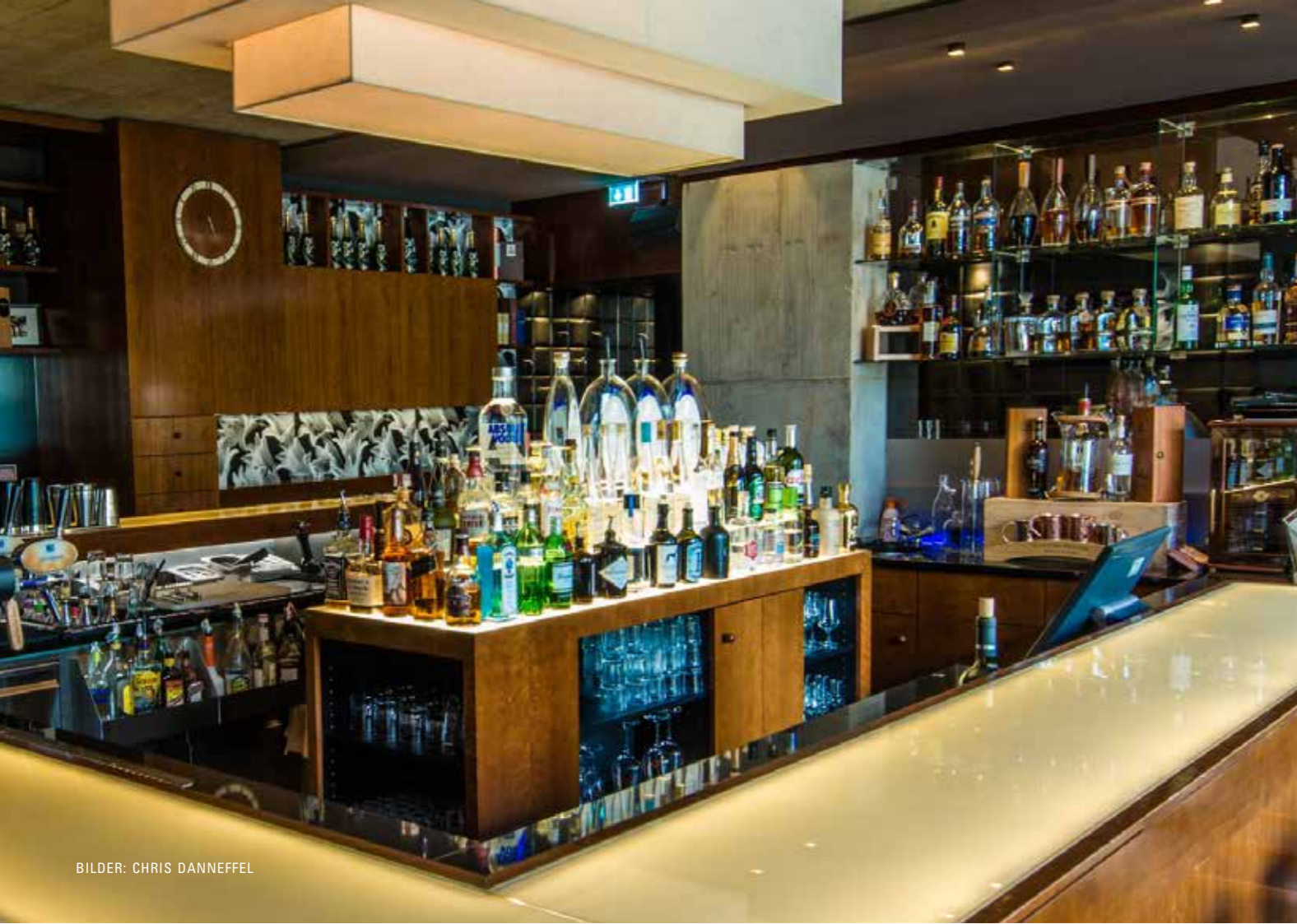
BILDER: CHRIS DANNEFFEL