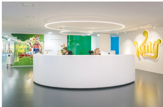
Im Bürokomplex des britischen Onlinespiele-Herstellers King in Stockholm – The Kingdom – bereichern Sitzlösungen von RH, einer Marke von Flokk, das kreative Arbeitsumfeld.

Düsseldorf, im August 2019 – (fpr) Vorangetrieben durch die Globalisierung und Digitalisierung sowie neue Technologien und Formen der Konnektivität, befindet sich die Arbeitswelt seit einigen Jahren grundlegend im Wandel. Unternehmensstrukturen, Bürokonzepte und Workflows werden vielseitiger und flexibler; ideenreicher Austausch, soziale Vernetzung und kollaborative Zusammenarbeit rücken vermehrt in den Fokus sogenannter New-Work-Konzepte. Gerade in den digitalisierten Aufgabenbereichen gewinnt auch die räumliche Umgebung zunehmend an Bedeutung, kann diese doch neue Perspektiven eröffnen, die Kreativität der Mitarbeiter fördern und zu innovativen Denkweisen anregen. Dies setzte sich auch der britische Onlinespiele-Hersteller King bei der Planung des neuen Bürokomplexes in Stockholm zum Ziel. Ein zentraler Baustein dabei war unter anderem die Bestuhlung mit Lösungen von RH, einer Marke von Flokk..