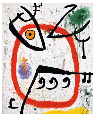
Joan Miró, Femme espagnole, 1972 © Successió Miró / VG Bild-Kunst, Bonn 2010 Foto: Joan Ramon Bonet