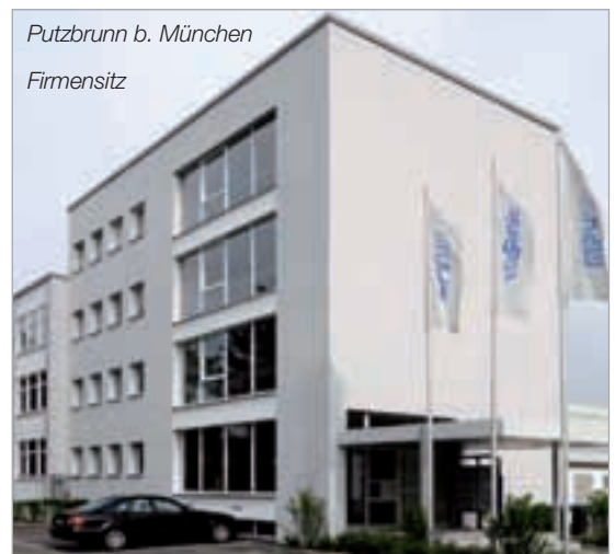
Putzbrunn b. München Firmensitz

Was bleibt, ist unser Faible für kompromisslose Qualität und besten Service für unsere Kunden und Partner.