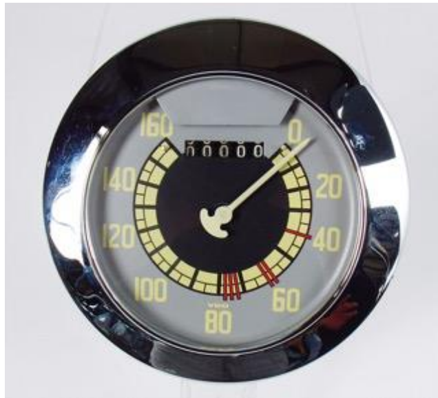
Tacho eines Porsche 356 Gmünd von 1949 ; verkauft für 10.070,- €