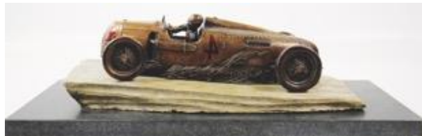
Lot Nummer 3076, Auto Union Bronzeskulptur Bernd Rosemeyer Ergebnis: 7.700,- €