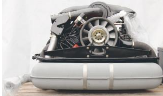
Antriebsaggregat Porsche 2.7 Carrera RS, Ergebnis 71,100,-€