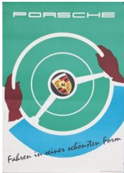
Lot Nummer 2063 Porsche Werbeplakat „Fahren in seiner schönsten Form“ von 1956 Ergebnis: 7.230,- €