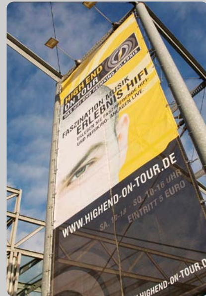
Plakat HIGH END ON TOUR

Veranstaltung: HIGH END® ON TOUR Ort: darmstadttium Wissenschafts- & Kongresszentrum Schlossgraben 1 64283 Darmstadt Wann: 4.2.2012 – 5.2.2012 Öffnungszeiten: Samstag, 04. Februar 2012, 10:00 bis 18:00 Uhr Sonntag, 05. Februar 2012, 10:00 bis 16:00 Uhr Eintritt: 5,00 Euro / Tageskarte Veranstalter: HIGH END SOCIETY MARKETING GMBH Hatzfelder Straße 161-163 42281 Wuppertal Telefon: 0202.70.20.22 Telefax: 0202.70.37.00 E-Mail: Info@HighEndSociety.de Internet: www.HighEndSociety.de Kontakt: Renate Paxa von 8:00 bis 13:00 Uhr Presse- & Öffentlichkeitsarbeit der HIGH END SOCIETY E-Mail: Renate.Paxa@HighEndSociety.de