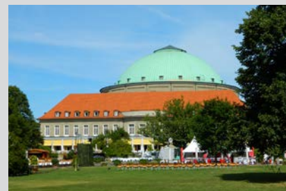
Hannover Congress Centrum

Bei der hochwertigen Tonwiedergabe geht es natürlich an erster Stelle um die Begeisterung und Leidenschaft für Musik, aber auch um das Kultivieren der Wahrnehmung, von Klang und Musik. Seien es strahlende Tenöre, profunde und satte Bässe mit spürbarer Präsenz oder ein warmer, voller und unverfälschter Gitarren-Sound, der sofort auf angenehme Weise ins Ohr geht. Musik mit großem Dynamikumfang, die Freude am Detail, die kleinen Feinheiten, die Musik noch klangvoller, runder und erhebender machen, sorgen für ein regelrechtes Gänsehautfeeling. Immer aber geht es darum, sich von guter Musik auch emotional berühren zu lassen und diese in ihrer Komplexität der Komposition auch intellektuell zu erfahren. An das Ergriffensein, angeregt durch ein schönes Musikerlebnis, erinnern wir uns noch nach Jahren. Eine gute Klangqualität ermöglicht bewusstes Hören, welches die Grundlage bildet für ein ganzheitliches Erfassen von Musik.