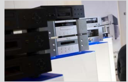
HiFi- und High End-Komponenten