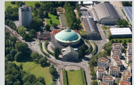
Hannover Congress Centrum