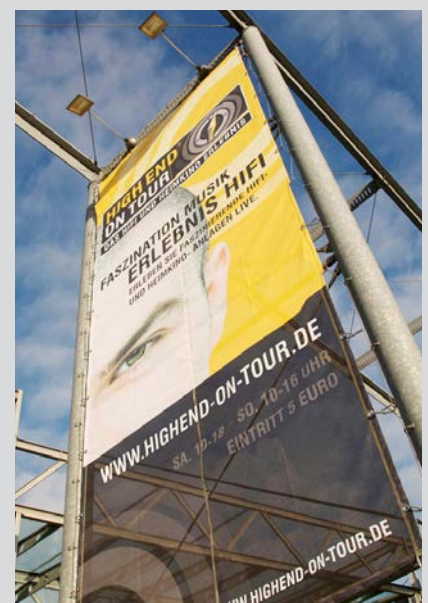
Plakat HIGH END ON TOUR