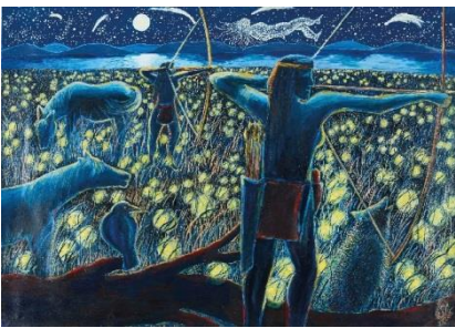
Bild 1: „Viele Lichter auf meinem Weg“ von Preisträgerin Ulrike Stilz