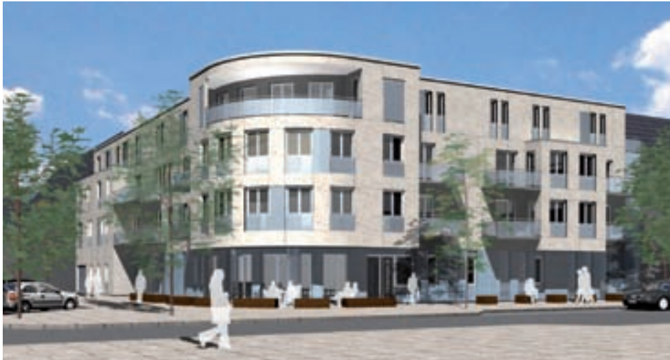
Der für die Realisierung ausgewählte Entwurf von Gutzeit + Ostermann Architekten, Hamburg