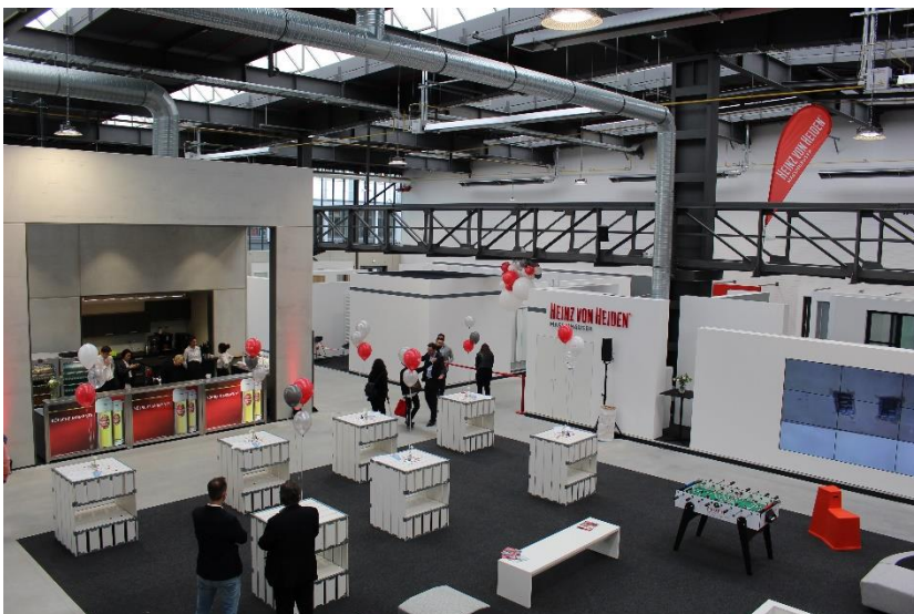
Blick auf das neue KompetenzCentrum von Heinz von Heiden im ehemaligen Drahtlager.