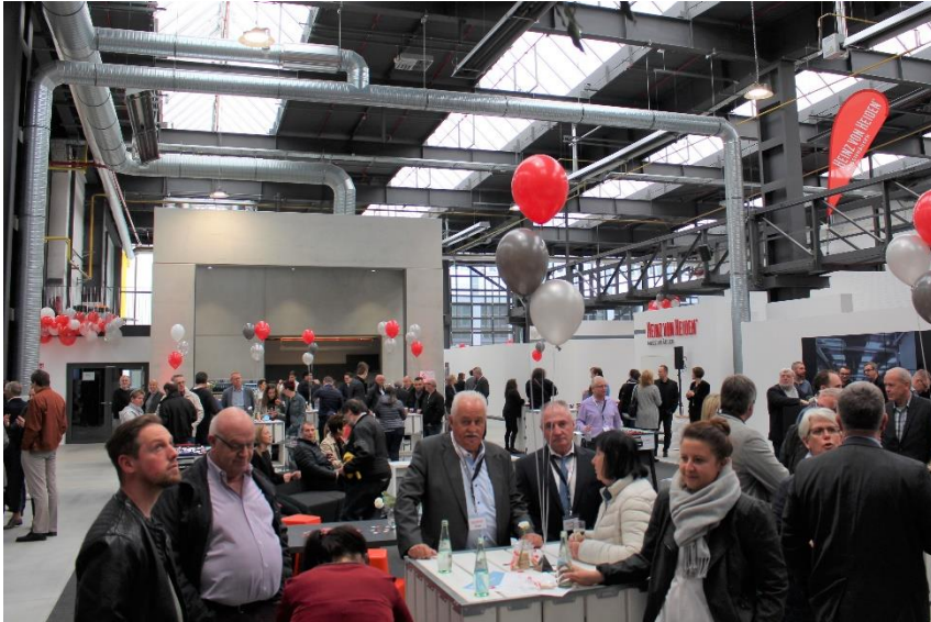
Zahlreiche Bauinteressierte und Geschäftspartner kamen zur feierlichen Eröffnung des neuen Standortes im Carlswerk.