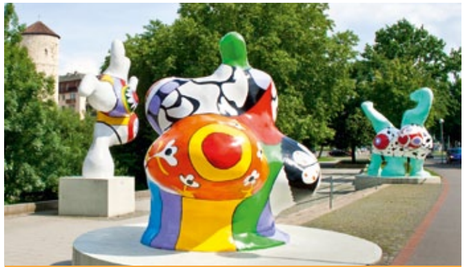
Nanas am Roten Faden