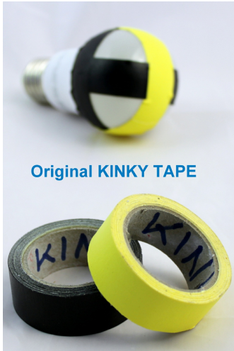
Original KINKY TAPE

Zur dekorativen Nachbesserung vorhandener LED-Lampen bietet der Vertreiber IDV GmbH das robuste Klebeband-Set Original KINKY TAPE in gelb und schwarz an.