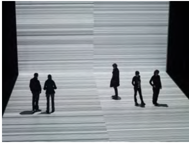
2015_globale_ryoji-ikeda_testpattern-n3.jpg Ryoji Ikeda, test pattern [n°3]