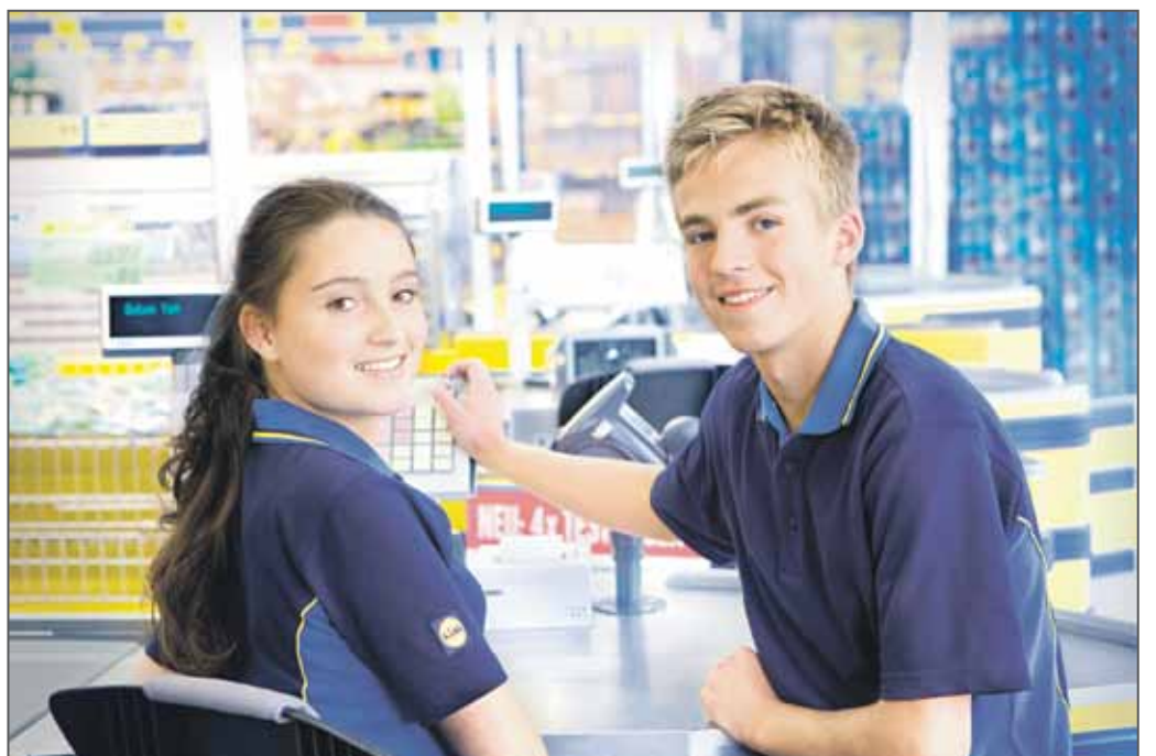
AUSBILDUNG BEI LIDL

Mit einem Duaalem Bachelor-Studium im Handel bereiten wir Sie auf die Übernahme einer Führungsposition nach Beendigung ihres Studiums vor. Und währenddessen übernehmen Sie während der jeweils dreimonatigen praktischen Studienphasen bei Lidl bereits erste verantwortungs-