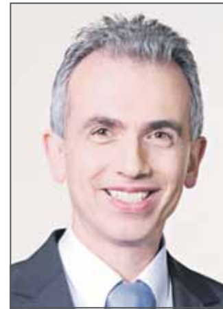
OBERBÜRGERMEISTER PETER FELDMANN