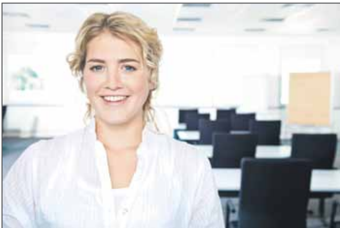
DUALES BACHELOR-STUDIUM

In der Ausbildung übernehmen Sie bei uns schon früh verantwortungsvolle Aufgaben. Zum Beispiel haben Auszubildende zum Kaufmann (w/m) im Einzelhandel die Möglichkeit, bereits während ihrer Ausbildung für zwei Wochen gemeinsam mit anderen Auszubildenden das komplette Tagesgeschäft einer unserer Filialen zu leiten – von der Warenbestellung über die Personalplanung bis zum Kassenabschluss. Bei persönlicher Eignung und guter Abschlussprüfung haben unsere Auszubildenden (w/m) gute