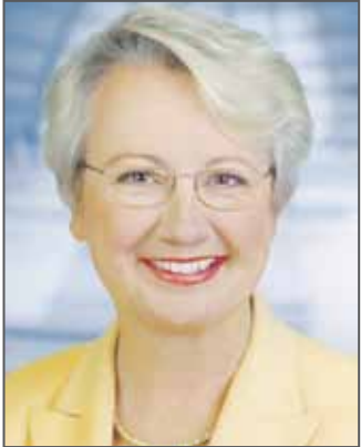
BILDUNGS MINISTERIN PROF. DR. ANNETTE SCHAVAN

Deutsche Unternehmen sind in vielen Bereichen Weltmarktführer: Vieles wurde und wird in unserem Land erfunden, entwickelt und produziert. Daran beteiligt waren und sind bestens ausgebildete und engagierte Ingenieurinnen und Ingenieure, Wissenschaftlerinnen und Wissenschaftler, Facharbeiterinnen und Facharbeiter sowie Fachangestellte.