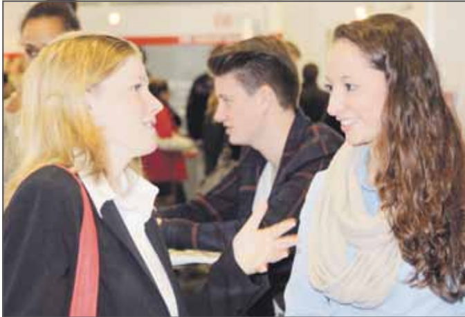
INFORMATIONEN AUS ERSTER HAND BEI DEN AZUBI- & STUDIENTAGEN [BILD: MMM]

Berufsorientierung, Bewerbung, Auslandsaufenthalt und vieles mehr