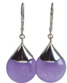
Yvesse Jade-Ohringe Bestellnr. 293 937 € 29,99