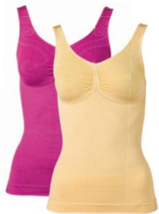
Schlankstütz Schmetterlingstop Größe: S-XXXL. Bestellnr. 291 592 € 44,99