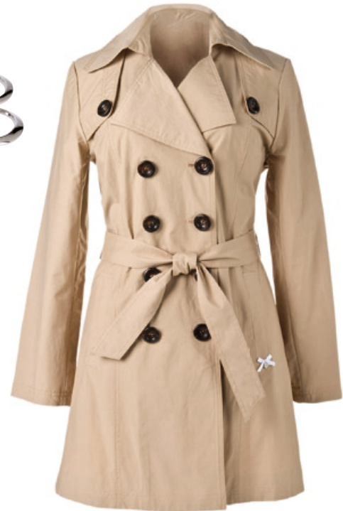
Himmelblau by Lola Paltinger Trench Größe: 34-50. Material: 70% Baumwolle, 30% Polyamid. Bestellnr. 295 116 € 139,99