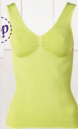
Schlankstütz V-Top Mit attraktiver Raffung und eingestricter Unterbrustfunktion. Größe: S-XXXL. Bestellnr. 291 158 € 44,99