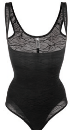
Dr. Rey Shapewear Body-Former m. besticktem Tüll Größe: S-XXL. Bestellnr. 301 260 € 52,99