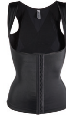
Dr. Rey Shapewear Top-Former Größe: S-XXL. Bestellnr. 301 265 € 47,99