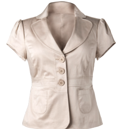
Sarah Kern Kurzarmblazer Bestellnr. 298 626 € 79,99