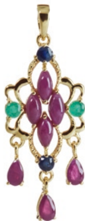
Jaipur Anhänger Bestellnr. 301 641 € 229,00