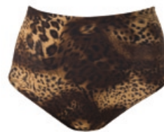
Dr. Rey Shapewear Bauchkontrollslip-Former Größe: S-XXL. Bestellnr. 292 736 € 24,99