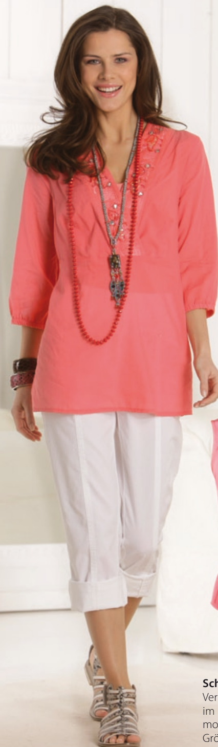
Sarah Kern Hose Größe: 34–54. Material: 58% Baumwolle, 40% Lyocell, 2% Elasthan. Bestellnr. 297 378 € 79,99