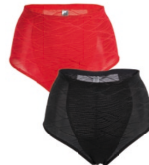
Dr. Rey Shapewear Slip-Former m. besticktem Tüll Größe: S-XXL. Bestellnr. 301 261 € 24,99