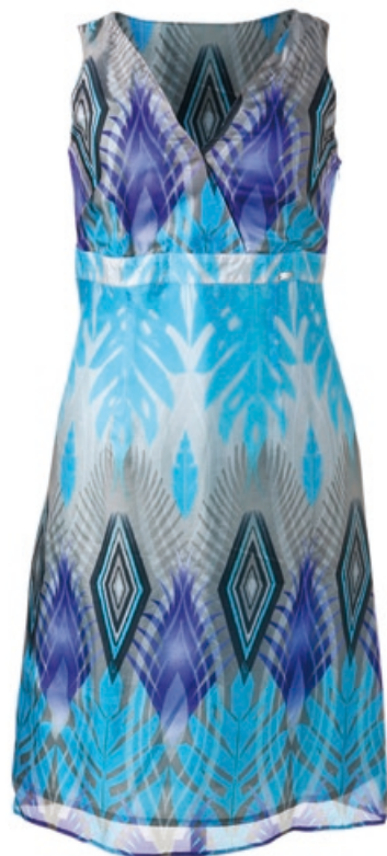
Sarah Kern Kleid Bestellnr. 294 267 € 139,98