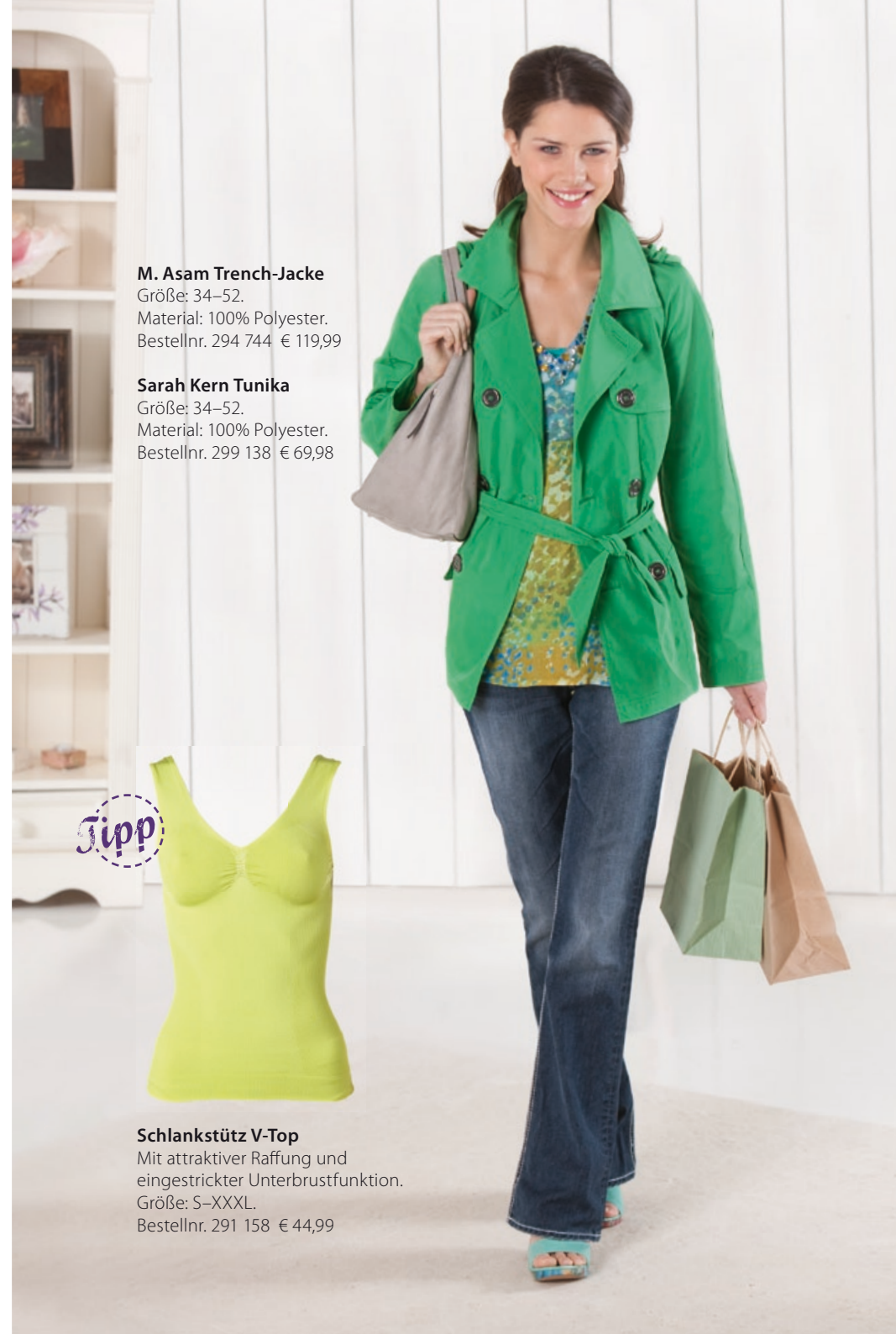
M. Asam Trench-Jacke Größe: 34-52. Material: 100% Polyester. Bestellnr. 294 744 € 119,99

Die Nutzung ist für redaktionelle Zwecke im wohlwollenden Zusammenhang mit HSE24 honorarfrei.