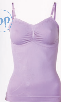
Schlankstütz Spaghetti V-Top Für eine schlanke Taille, das auslaufende Bündchen kaschiert selbst breitere Hüften. Größe: S-XXXL. Bestellnr. 293 538 € 42,99