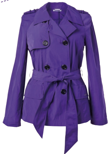
M. Asam Trench-Jacke Bestellnr. 294 744 € 119,99