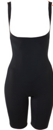
Dr. Rey Shapewear Body-Former mit Bein Größe: S-XXL. Bestellnr. 292 734 € 52,99