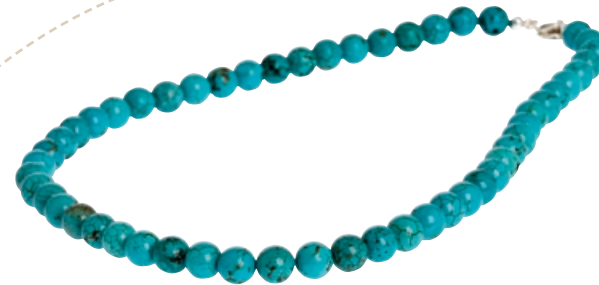
Yvesse Edelsteinkette Bestellnr. 289 681 € 29,99