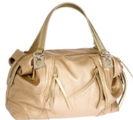
Catwalk Trends Tasche "Hollywood" Bestellnr. 299 028 € 42,99