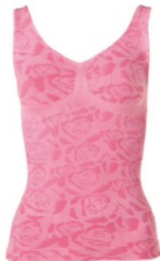
Schlankstütz Top mit Rosenmuster Größe: S-XXXL. Bestellnr. 287 620 € 44,99