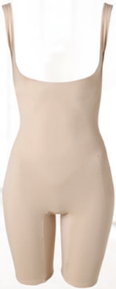
Dr. Rey Shapewear Body-Former mit Bein Der formgebende Body kaschiert perfekt alle weiblichen Problemzonen. Größe: S-XXL. Bestellnr. 292 734 € 52,99