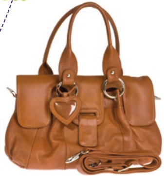
Eve & Ella Shoppertasche Material: 100% Leder. Bestellnr. 294 990 € 139,98