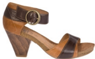
Caprice Sandale Größe: 36–42. Bestellnr. 299 168 € 49,99