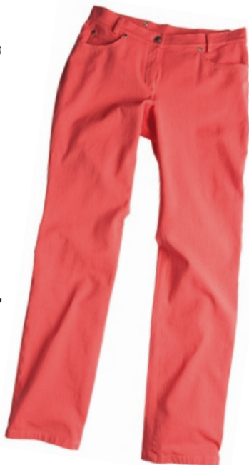
Sarah Kern Hose Größe: 34–54. Material: 95% Baumwolle, 5% Elasthan. Bestellnr. 298 448 € 79,99

Die Nutzung ist für redaktionelle Zwecke im wohlwollenden Zusammenhang mit HSE 24 Honorarfrei.