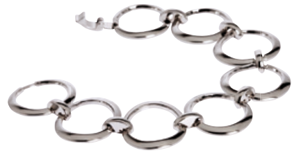
Judith Williams Armband Bestellnr. 301 617 € 34,99