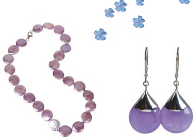
Perlensymphonie Kette Bestellnr. 300 979 € 69,98