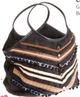
Catwalk Trends Tasche "Safari" Bestellnr. 291 762 € 49,99