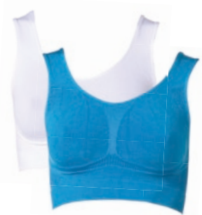
Schlankstütz Rundhals-Bustier Größe: S-XXXL. Bestellnr. 289 771 € 29,99