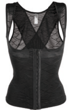
Dr. Rey Shapewear Top-Former m. besticktem Tüll Größe: S-XXL. Bestellnr. 301 259 € 49,99

Die Nutzung ist für redaktionelle Zwecke im wohlwollenden Zusammenhang mit HSE24 honorarfrei. Foto: HSE24 +++ Copyright Informationen: HSE24