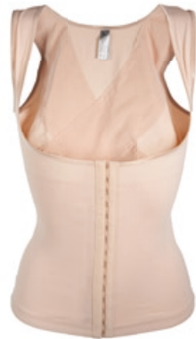
Dr. Rey Shapewear Top-Former Größe: S-XXL. Bestellnr. 301 265 € 47,99