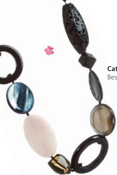
Catwalk Trends Kette "Safari" Bestellnr. 291 760 € 47,99