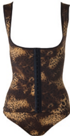
Dr. Rey Shapewear Body-Former Größe: S-XXL. Bestellnr. 292 735 € 49,99