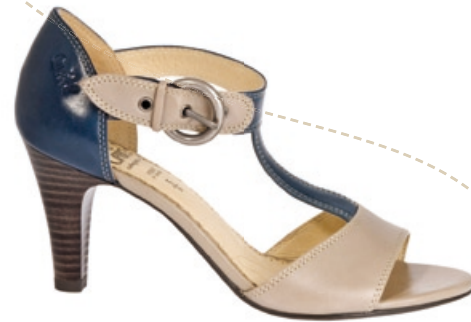
Caprice Sandalette Größe: 36-42. Bestellnr. 297 983 € 49,99