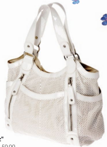
Catwalk Trends Tasche "St. Tropez" Bestellnr. 291 761 € 59,99