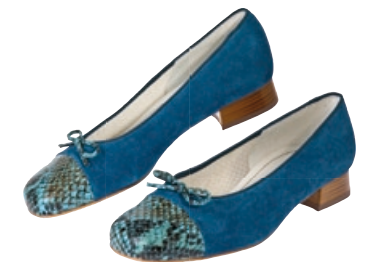
Gerwinia Veloursleder Ballerina Größe: 35,5-42. Bestellnr. 301 074 € 69,98