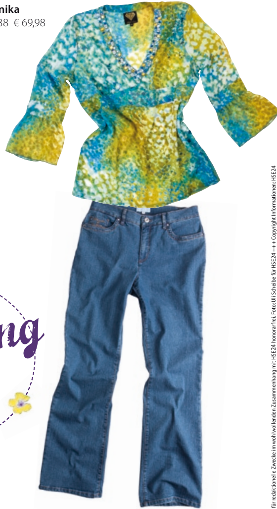
Sarah Kern Tunika Bestellnr. 299 138 € 69,98