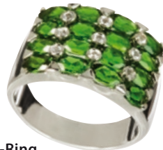
Yvesse Chromdiopsid-Ring Bestellnr. 277 732 € 69,98

Die Nutzung ist für redaktionelle Zwecke im wohlwollenden Zusammenhang mit HSE24 honorarfrei.