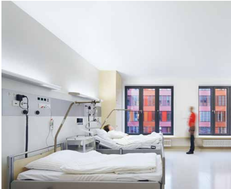
B2 | Sand- und Erdtöne sorgen in den Patientenzimmern für einen fast wohnlichen Charakter.