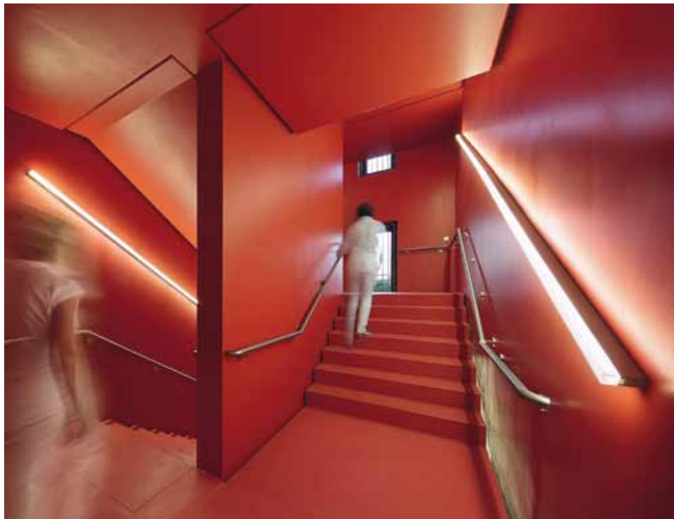
B3 | Die Treppenhäuser bieten durch unterschiedliche Farben Orientierung. Linaria Leuchten empfinden den Treppenlauf nach und wirken wie ein leuchtendes Pendant des Geländers.