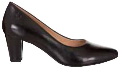
CAPRICE PUMPS Material: 100% Leder Größen: 36-42 Bestellnr. 309459, € 69,98