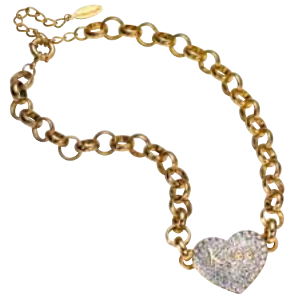
RICARDA M. KISS ME KETTE Material: gelbvergoldet, mit Kristallen Länge: ca. 46 cm Bestellnr. 320728, € 39,98