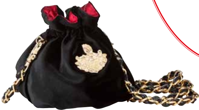
RICARDA M. MUNICH GLAMOUR TÄSCHCHEN Material: 92% Polyester, 8% Elasthan Bestellnr. 321566, € 24,99