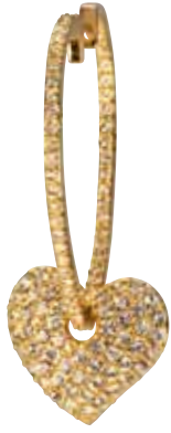
RICARDA M. CRAZY IN LOVE CREOLEN Material: gelbvergoldet, mit Kristallen Bestellnr. 320725, € 37,98