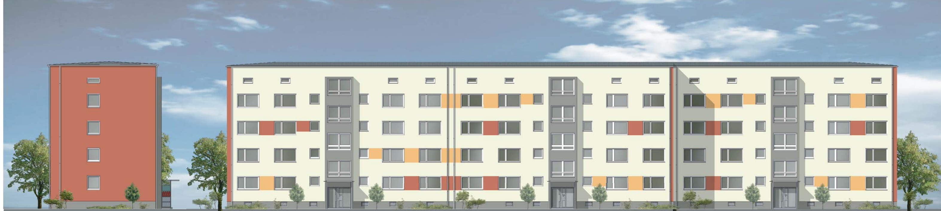
Ausführungsvariante Stand 27.04.2007 Haus 20-22-26 (Typ A4 + A4 + A4)